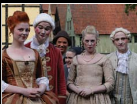
Den politiske Kandstøber, sommer 2009