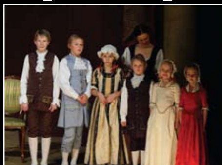
Juule-/Stuen, vinter 2008