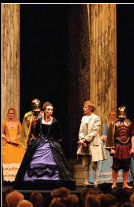
Orestes, efterår 2009. Tragedie af Euripides

Teaterselskabet PULCHRA SEMPER VERITAS opfører